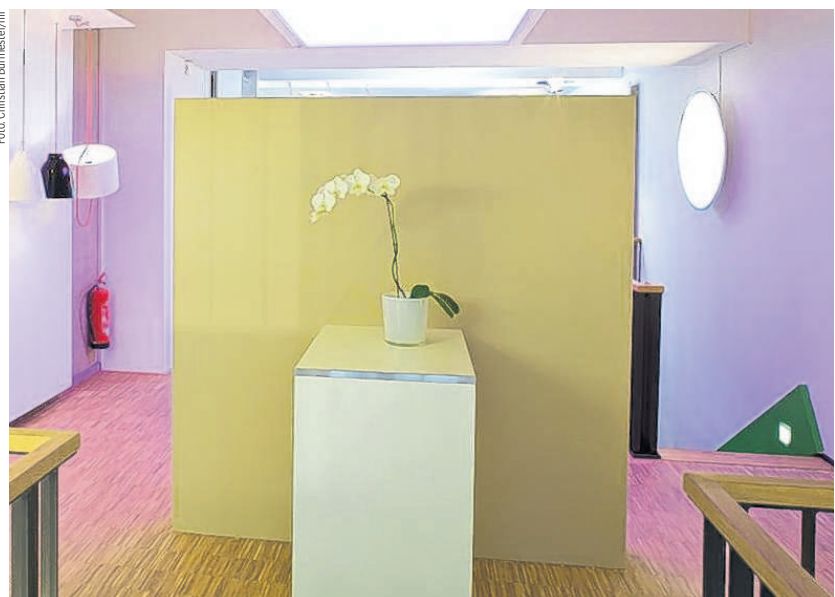
Eine Raumgestaltung nach Feng Shui ist nicht auf den ersten Blick zu erkennen. Hier soll der Raumteiler verhindern, dass der positive Energiefluss Chi nicht durch die lange Gerade des Zimmers gebremst wird.