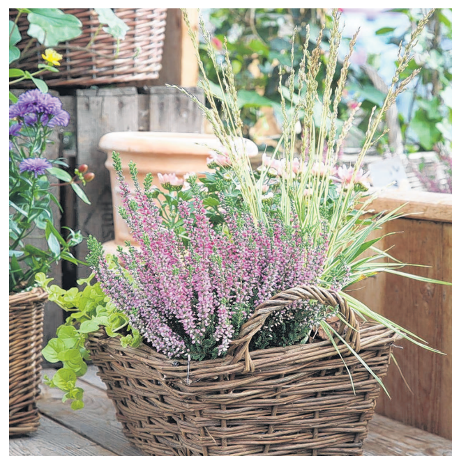
Auf jedem Balkon ein dekorativer Blickfang ist blühende winterfeste Erika.