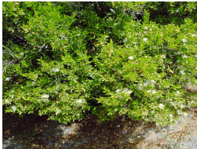
Wichtig ist der Einsatz natürlicher Duftstoffe wie ätherischer Öle, die aus Blüten, Blättern, Nadeln, Samen, Früchten, Wurzeln, Rinden, Ästen und Zweigen gewonnen werden

ten von natürlichen Düften nutzen? Es gibt zweifelsohne viele Möglichkeiten und Anlässe, von den positiven Auswirkungen der natürlichen Duftaromen zu profitieren. Sinn und Zweck dabei soll sein, Menschen zu führen und nicht, sie zu beeinflussen. Das kann zur Eigenmotivation im „duftenden Büro“ sein und ebenso für die ganzheitliche, alle Sinne ansprechende Raumgestaltung in Ausstellungs- sowie auch in Verkaufsräumen.