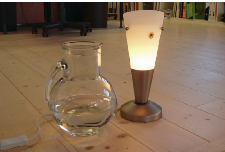
In einer sechswöchigen Studie mit 32 Firmen aus unterschiedlichsten Branchen von München bis Hamburg wurden Büros mit ätherischen Ölen beduftet

den Tempeln der Buddhisten beispielsweise verbrannten Räucherwerke, die den Geist ansprechen sollten. Auch in der katholischen Kirche steht heute noch der Weihrauch symbolisch für Reinigung, Verehrung und Gebet mit dem Hintergrund, dass im Gottesdienst alle Sinne angesprochen sind, der Geruchssinn ebenfalls.