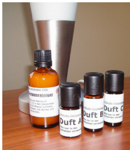
Eingesetzt waren Düfte der Zitrone (= anregend, erfrischend, Luft reinigend), Orange (= optimistisch stimmend, ausgleichend wirkend) sowie der Douglasfichte (= Konzentration fördernd, Luft reinigend). Alle drei Öle sind leicht flüchtig und wirken kaum aufdringlich

Oliva Maitra, 27367 Sottrum Tel 04264 3708588 www.oliva-maitra.de