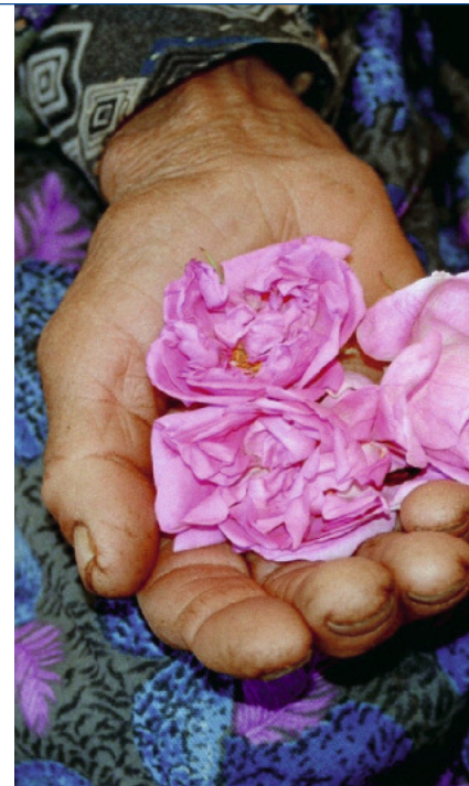
Ätherische Öle mit den Duftnoten der Zitrone, Orange, Rose und Myrthe regen das Empfinden der Menschen besonders an

Die positive Wirkung von Raumdüften fürs Marketing und im Arbeitsprozess