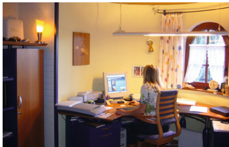
Mitarbeiter in einem bedufteten Büro verfeinern ihr Geruchsempfinden und sind gegenüber Wahrnehmungen besser sensibilisiert. Sie verfügen über eine höhere Konzentrationsfähigkeit, fühlen sich insgesamt wohler und sind leistungsfähiger

ren, brauchen bis zu zwei Stunden, um ihren vollen Duft zu entfalten. Dafür bleiben sie jedoch 24 Stunden und sogar länger wirksam und klingen danach ganz allmählich ab. Warum also nicht auch im Holzhandwerk die positiven Eigenschaf-