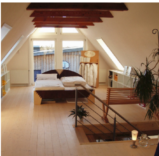
Düfte können auch für die ganzheitliche Raumgestaltung in Ausstellungs- und Verkaufsräumen eingesetzt werden. Im Schlafzimmer signalisieren die Duftnoten von Lavendel, Vanille und Neroli einen entspannenden Schlaf ...

Das Beduften von Räumen wird nahezu genau so lang praktiziert wie das Beduften der Menschen. Vor mehr als 3000 Jahren wurden in China schon Räume beduftet. In